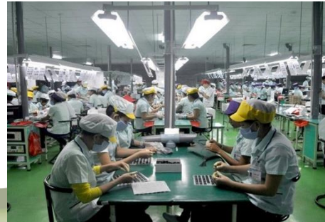
สถานประกอบการ