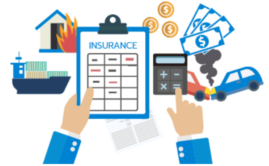
การประกันภัย