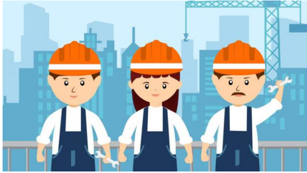
กำหนดมาตรการความปลอดภัย