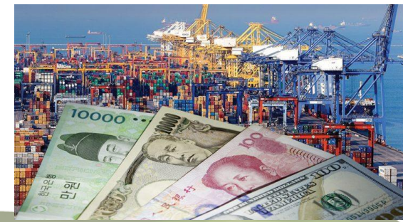
ประเทศชาติ