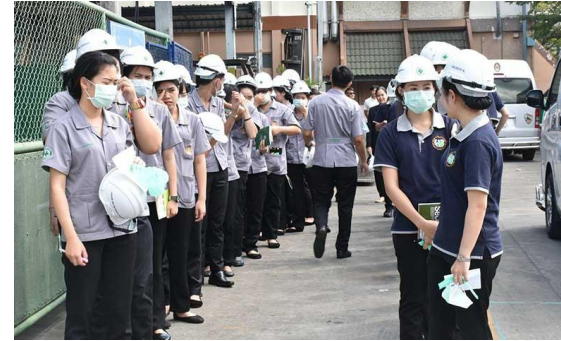
การศึกษา